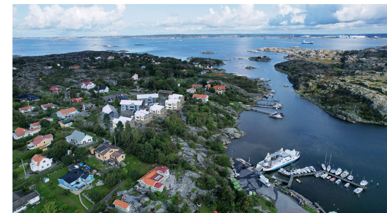
Drönbild med tillkommande bebyggelse enligt förslaget inplacerad i sin omgivning. Bebyggelseförslaget är framtaget av AL Studio.