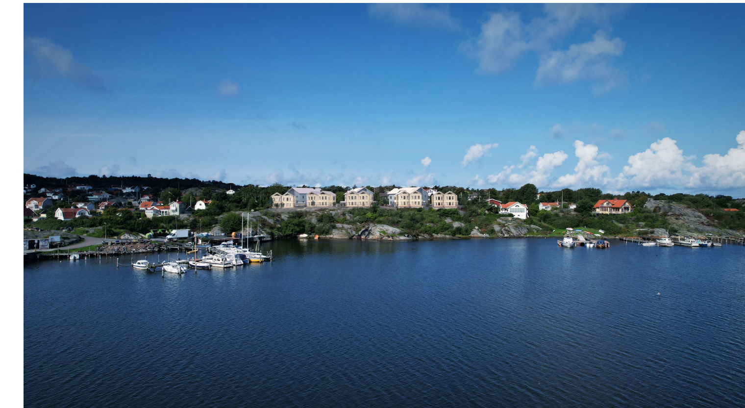
Drönbild med tillkommande bebyggelse enligt förslaget sett från vattnet. Bilden är tagen på 60 meters höjd över havet. AL Studio.